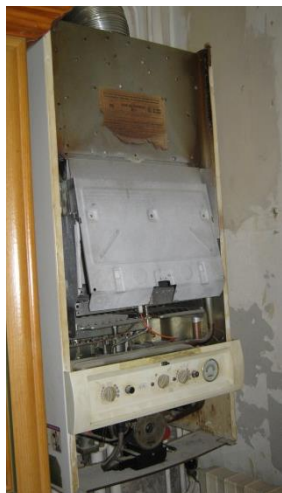
▲ ► Avant travaux